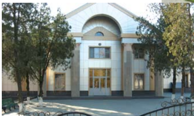
ЗАО «имени Дзержинского»

В Азовском районе расположено 220 532 га сельхозугодий, в том числе 190 801 га пашни. На землях района трудится 509 сельскохозяйственных товаропроизводителей всех форм собственности. Структуру продукции сельского хозяйства района формирует продукция растениеводства (78,0%) и животноводства (22%). В 2019 году валовой сбор зерновых и зернобобовых культур составил 522 тыс. тонн, урожайность – 43,1 ц/га. Было собрано 458,5 тыс. тонн основной продовольственной культуры – озимой пшеницы. Средняя урожайность составила 45,1 ц/га. Объем производства подсолнечника составил 89,3 тыс. тонн, урожайность – 24,3 ц/га; картофеля – 2,2 тыс. тонн, урожайность – 159,5 ц/га, овощей – 44,4 тыс. тонн, урожайность – 347,1 ц/га, сахарной свеклы – 330,3 тыс. тонн, урожайность – 428,8 ц/га. В теплицах на площади 3,5 га выращено 1,1 тыс. тонн овощей.